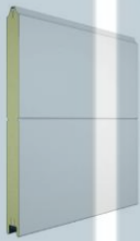
M – Гофр